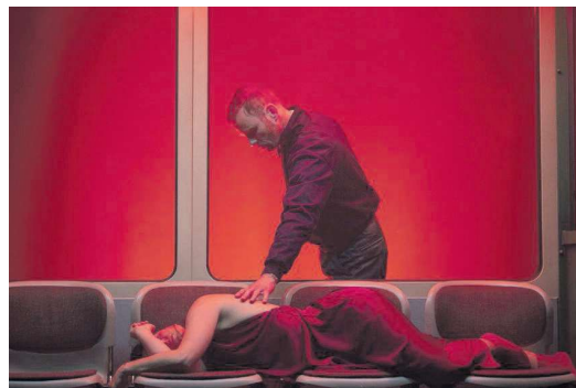
Nachtschade van Het Nationale Theater.

Nachtschade van Het Nationale Theater, première 25/4, Theater aan het Spui, Den Haag; daarna tournee t/m 13/6.